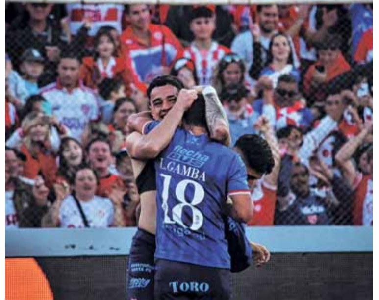
Agrandado. El Tate se fue a las vacaciones como líder de la Liga Profesional.