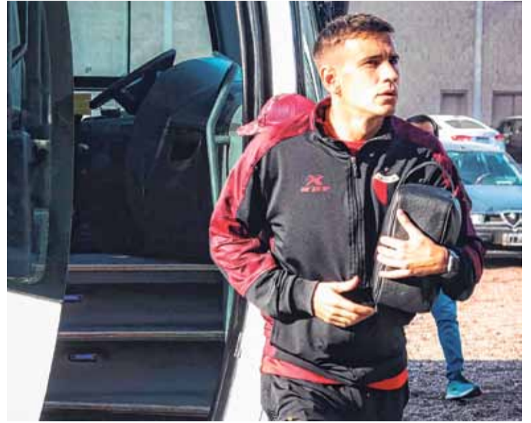
Ambicioso. Jourdan derrochó confianza por el momento de Colón.

Lo concreto es que Juncos nunca pudo ganarse un lugar como titular en Colón, y quedó marcado por haber fallado el penal en el final del partido ante Mitre, en Santiago del Estero.