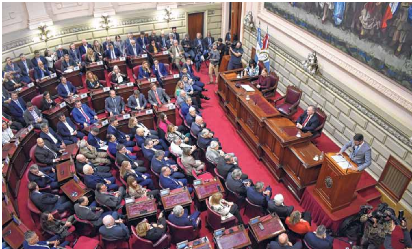
LEGISLATURA. El tiempo es veloz y el objetivo de convertir en ley la necesidad de modificar la Carta Magna sobre fin de año entró en zona de dudas.